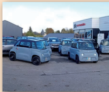
10 voiturettes électriques AMI